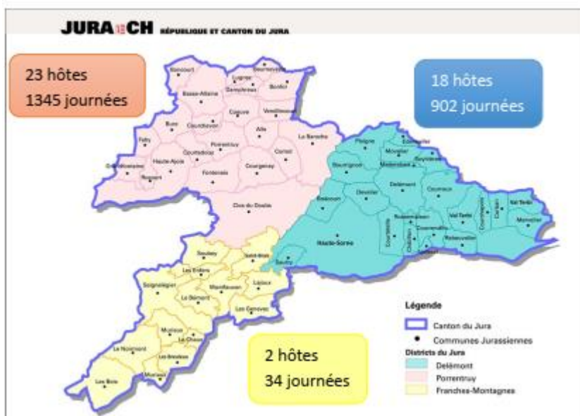
Figure 1 - Statistiques 2021

Pour ouvrir une antenne à Vicques, l'Association a besoin d'une autorisation d'exploitation du Canton. Celle-ci lui sera délivrée à condition que la Commune siège (physique) s'engage à lui fournir des avances de financement.