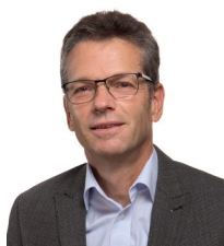
L'édito du Maire