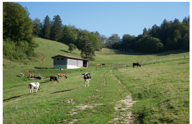
Pâturage de la Chèvre avec sa loge en arrière-plan

L'importance d'une maîtrise de compétences pointues en économie pastorale a poussé les exploitants agricoles de Montsevelier à entrer en discussion avec la Commune de Val Terbi et sa Commission bourgeoise de Montsevelier pour envisager une nouvelle forme de collaboration, mieux adaptée. C'est ainsi qu'assez rapidement, il s'est avéré que le transfert des compétences de gestion des pâturages à la collectivité des agriculteurs de Montsevelier était une solution permettant de préserver les intérêts de chacun. La Commune de Val Terbi et sa Commission bourgeoise ont donc conclu un contrat de fermage des pâturages avec la SEPM qui exploite dès lors de manière autonome les pâturages.