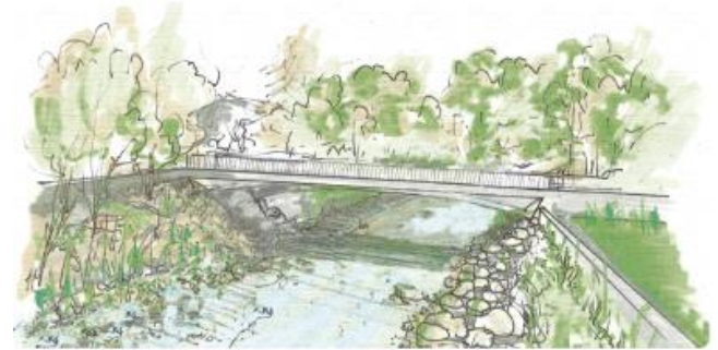
Croquis illustratif du nouveau pont de Recolaine © - ATIS SA - EG - BIOTEC - URBAPLAN

Le plan des équipements, figurant dans le dossier, précise la nature et l'emplacement des différents équipements techniques. Il prévoit le remplacement des équipements publics de franchissement des cours d'eau. Le nouveau pont de Recolaine sera plus long et plus haut. Son intégration paysagère sera particulièrement soignée. Le nouveau voûtage du Biel de Val permettra de tripler sa capacité d'écoulement actuel. Des cheminements de mobilité douce ainsi que la passerelle d'Es Montès font partie du projet.