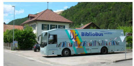
Le bibliobus à Vermes

N'hésitez pas à monder à bord d'un des bibliobus pour y compléter une fiche d'inscription. La cotisation annuelle pour l'abonnement standard est de Fr. 5.- par enfant et Fr. 18.- par adulte.