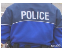
Le village de Vicques connaît une vague de cambriolages.

Les communes de Val Terbi, Courchapoix, Courroux, Mervelier et Corban donnent leur accord à la fusion des deux Services d'incendie et de secours (SIS) . La fusion sera effective au 1er janvier 2016.