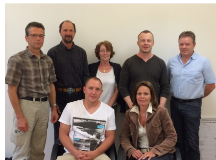
Le Conseil communal