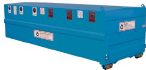
Nouvelle benne à verre

Le verre mélangé, ne peut, en revanche, être utilisé