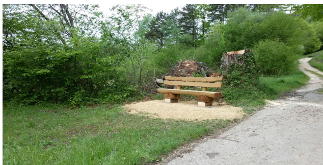
Réaménagement d'un coin détente à Montsevelier (ciblerie)