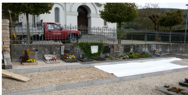
Réaménagement partiel du cimetière de Montsevelier