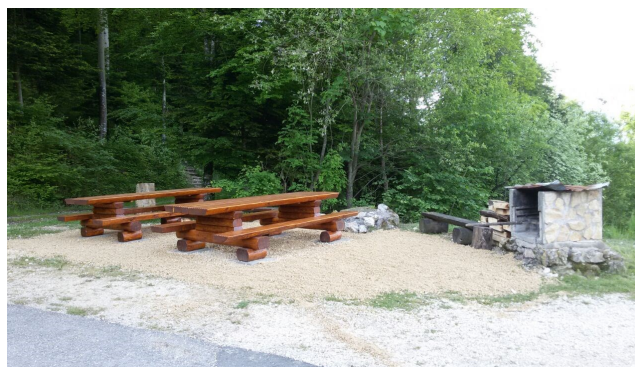
Cabane Ma Vallée, après le remplacement des tables extérieures