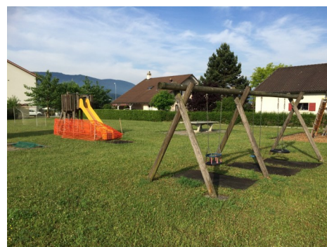
Aire de jeu « Les Toyers » à Vicques - accès barré au toboggan

Au vu de cette interpellation, le Conseil communal a pris la décision, par acquis de conscience, de supprimer sans délai les jeux incriminés. Cette intervention réalisée dans l'urgence n'a malheureusement pas été accompagnée d'une information correcte des citoyens, raison de la parution du présent article.