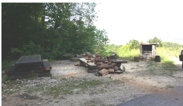
Cabane Ma Vallée, Montsevelier, avant l'intervention de la voirie