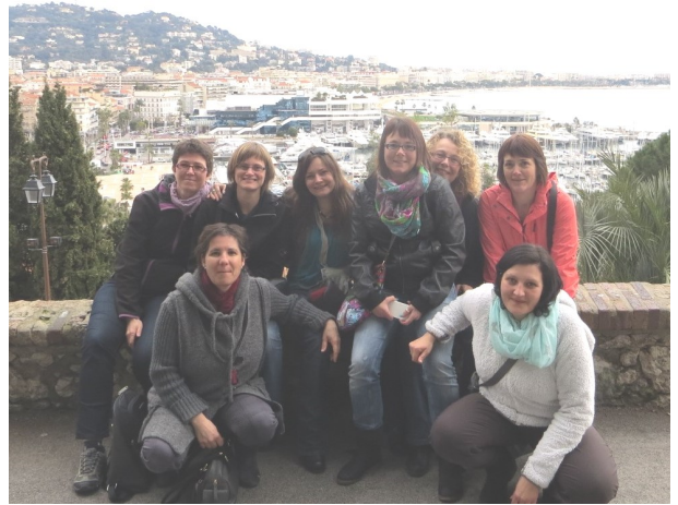
Les ludothécaires de Vicques en visite sur la Croisette au Festival du jeu.

A la ludothèque de Vicques, les favoris des enfants ne sont pas oubliés. L'offre de Playmobil, Duplo ou autres jeux TipToi est régulièrement renouvelée.